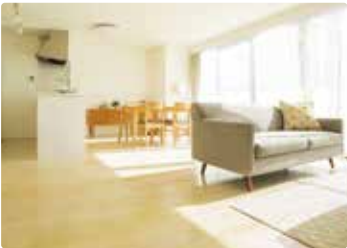
〔 リビング 〕