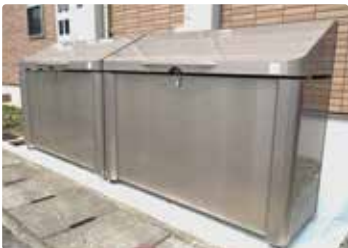
〔 ダストスペース 〕