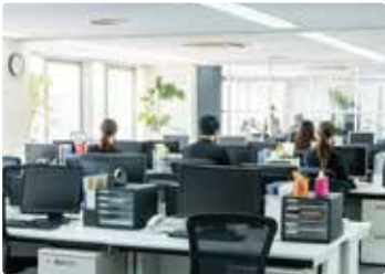
〔 オフィス 〕