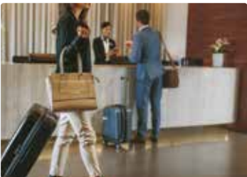
〔 ロビー 〕