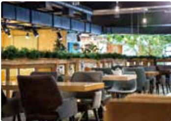
〔 レストラン・カフェ 〕