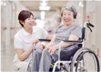
〔 老健施設 〕