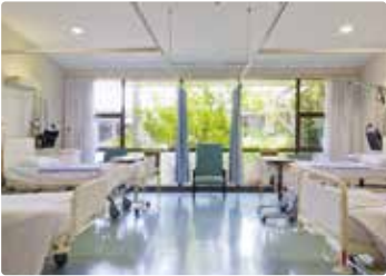
〔 病室 〕