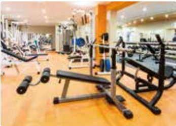
〔 フィットネス 〕